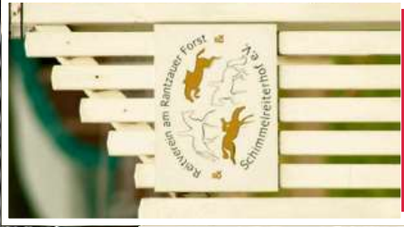
Seit über 30 Jahren ist der Schimmelreiterhof in Rahlstedt für Ross und Reiter da